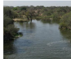
↔ Cortina de la Presa La Vega