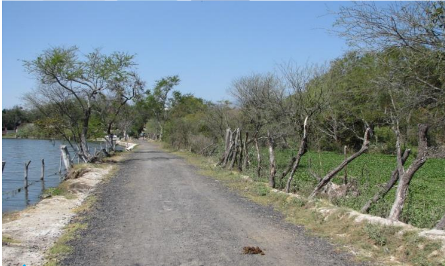
↕ Andador Teuchitlán – La Estanzuela