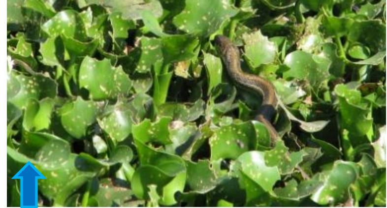
Mancha de lirio fuera del embalse, en el canal de descargas de La Estanzuela.