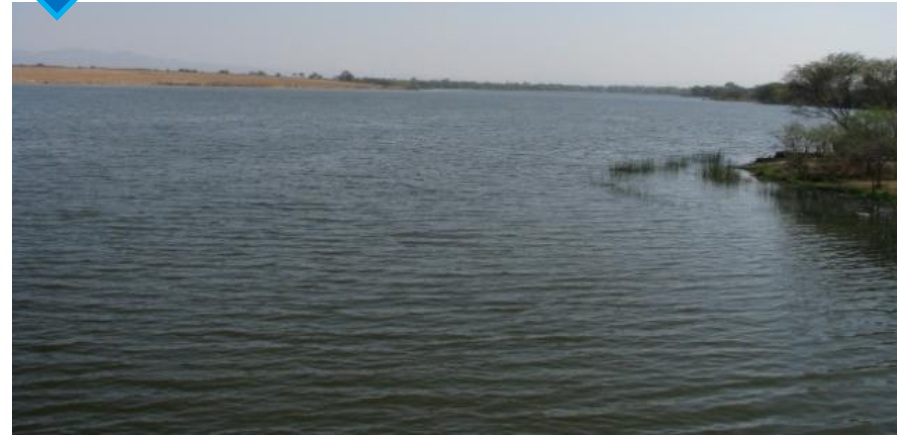
↓ Zona sureste (lateral de la cortina)