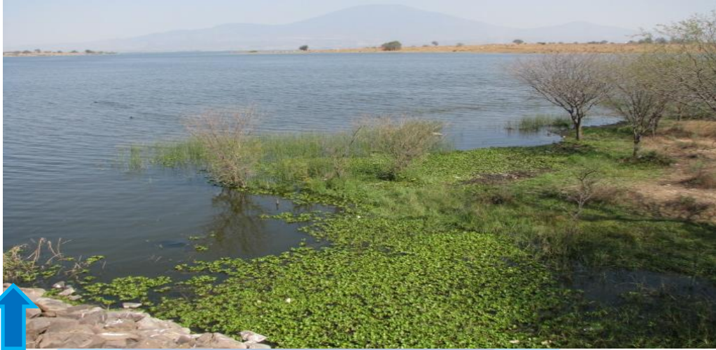
Mancha de lirio pequeño en el lateral de la cortina.