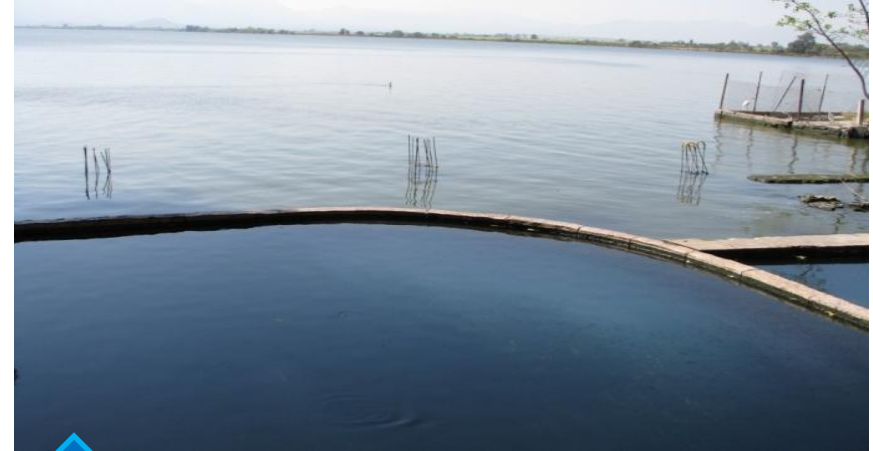
↑ Zona Teuchitlán (restaurantes)