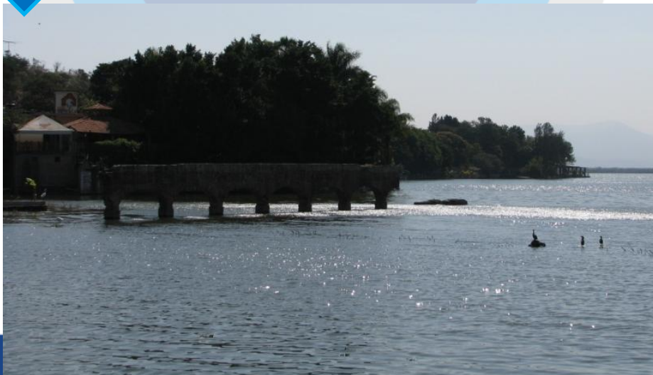
↓ Zona Teuchitlán (restaurantes y pesca)