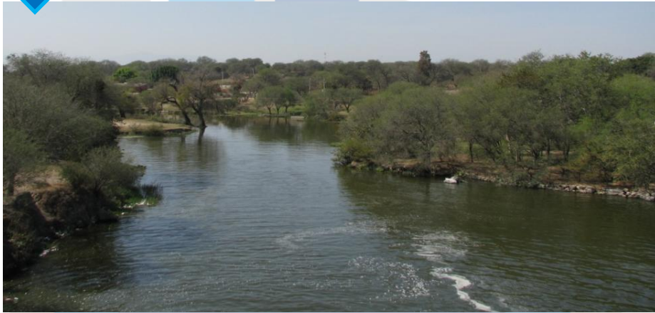
↓ Río Ameca