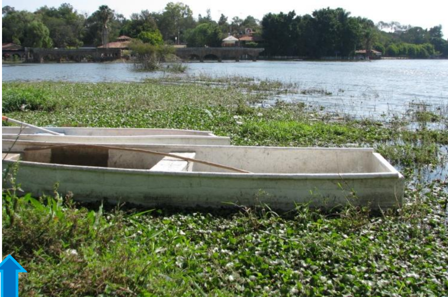
Mancha de lirio pequeño en la salida de la descarga Teuchitlán.